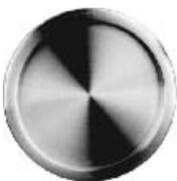
Réf. IN16528, AISI 304