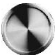
Réf. IN16527, AISI 304